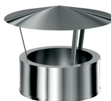
Uzávěr vedení se stříškou 120/220/0,6mm-výška 150mm