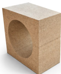
Bezpečná průchodka FIRESTOPBOX 330x330x100/200/400mm