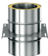
Základová deska průchozí 120/220/0,6mm-délka 500mm