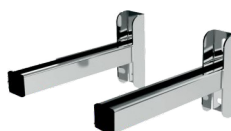
Nosná konzole 475 mm Odstup komínu až 240 mm