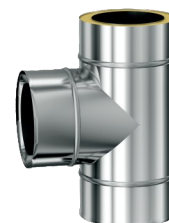
T KUS 90 120/220/0,6mm-délka 500mm