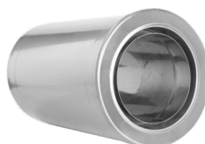
Prodloužení 500mm s integrovanou zděří 120/220/0,6mm-délka 500mm