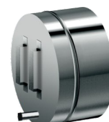
Nádoba na saze 120/220/0,6mm-výška 105mm spodní výběr sazí