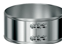
Spojka široká 120/220/0,6mm